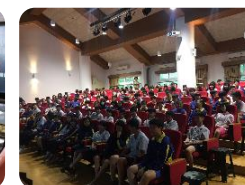
多功能教室 (容納 200 人)