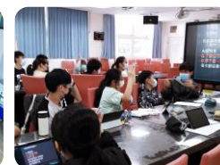
利用平板 進行學習