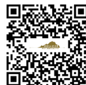
國家文化記憶庫入口網站