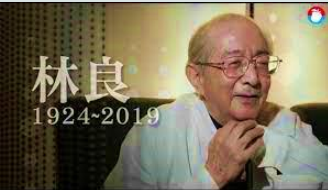
2020中國金鼎獎 年度卓越第三方支付平台 匯付天下