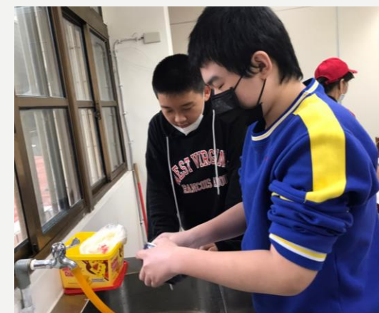
陪709 909學生 洗碗刷牙洗臉