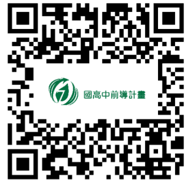
立即掃描 QRCode 報名