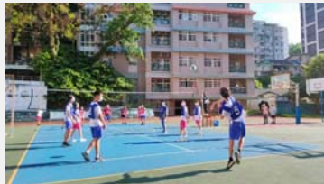
八年級班際排球比賽