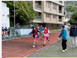
七年級大隊接力比賽