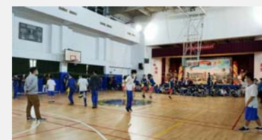
七年級班際跳繩比賽