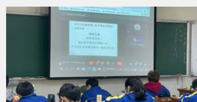
低碳校園教育宣導