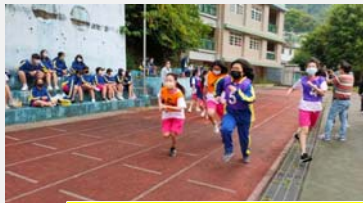
七年級大隊接力比賽