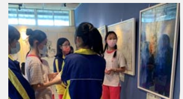
在新北遇見大師 《游於藝》巡展