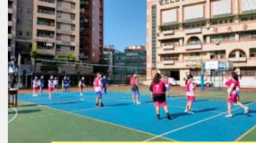
八年級班際排球比賽