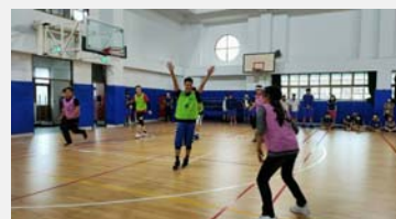
八、九年級籃球 三對三活動