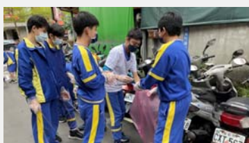
七年級社區服務學習