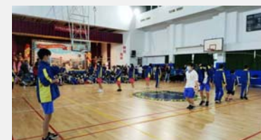
七年級班際跳繩比賽