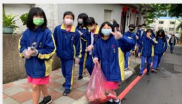
七年級社區服務學習