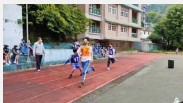
七年級大隊接力比賽