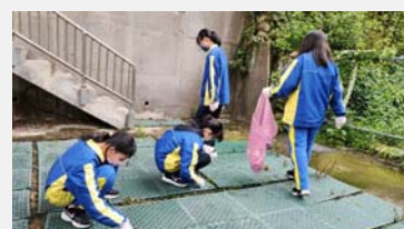
七年級社區服務學習