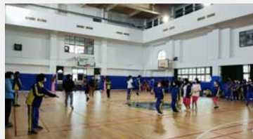
七年級班際跳繩比賽