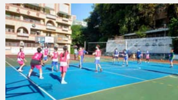
八年級班際排球比賽