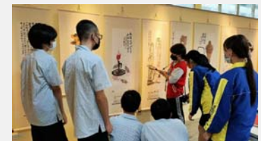
在新北遇見大師 《游於藝》巡展