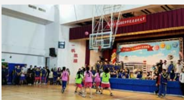
八、九年級籃球 三對三活動