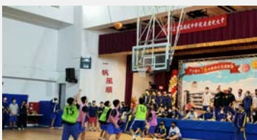
八、九年級籃球 三對三活動