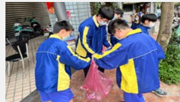
七年級社區服務學習