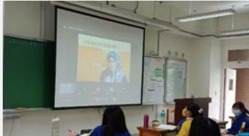
法律專題巡迴演講