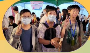
臺灣科學節薙夜市