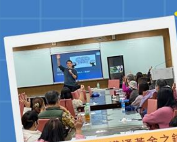
澤爸-打開親子溝通黃金之鑰