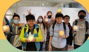
雄獅文具想像力製造所