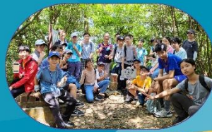
暑假營隊-東眼山森林修煉術