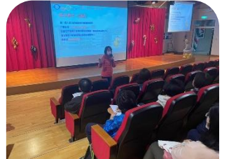
資優鑑定家長說明會