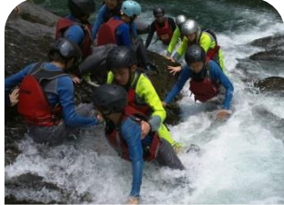
探索教育-烏來溯溪