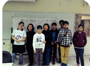
德國 Surfer 軟體研習