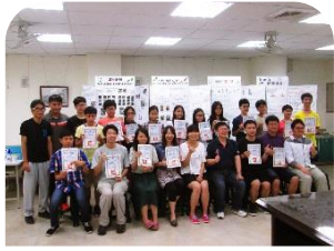
獨立研究成果發表